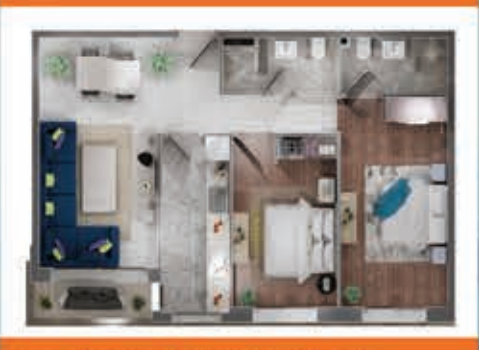
Appartement 3 chambres / salon